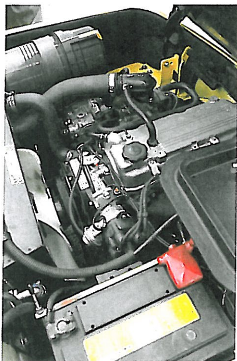
De lpg-trucks krijgen niet alleen een gloednieuwe Mazda-motor, ook de lpg-installatie is nieuw

reconditionering het best, bij brons is het vooral de prijs die de doorslag kan geven. Ook Still heeft een centrale occasion-werkplaats in ontwikkeling. Atlet heeft haar complete occasion-aanbod onlangs ondergebracht op de website heftruckmarkt.nl. De gebruikte Atlet trucks worden op deze site geclassificeerd met sterren, in verhouding tot de staat waarin zij worden aangeboden. De trucks die Atlet voor de eindgebruikermarkt aanbiedt, verdienen de vijfsterren status: ze worden compleet gereconditioneerd en zijn voorzien van een uitgebreide garantie. Net als vele aanbieders op de markt beantwoordt MotraLinde de vraag naar goedkopere transportoplossingen ook met een passende gebruikte truck of een mix van koop en korte termijnverhuur. Afhankelijk van het werk beslist de klant om de truck eventueel aan te schaffen. Duidelijk is in elk geval dat het aantal opties en de flexibiliteit van het aanbod groter is dan ooit. Ook het verlengen van bestaande leasecontracten na afloop van de contractperiode blijkt een goede mogelijkheid te zijn om toch door te kunnen werken tegen aanmerkelijk gunstigere voorwaarden.